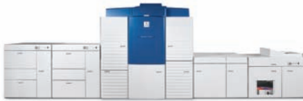
xerox iGen3 mit 110 Farbseiten pro Minute BigSize Bogenformat 571 x 364 mm